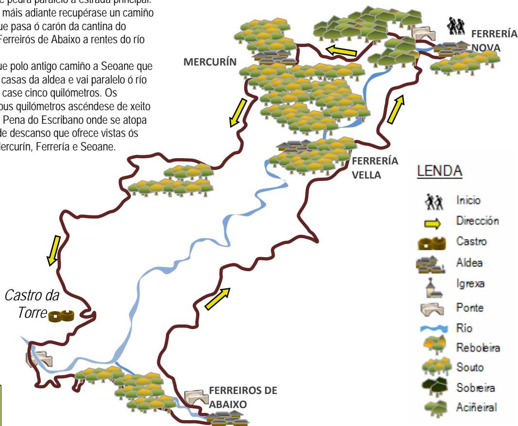
Ruta da Castro da Torre